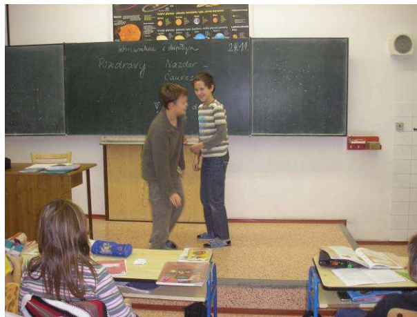
zkusíme to znovu

V závěrečné části s názvem Mezinárodní komunikace jsme se věnovali různým způsobům mezinárodní komunikace přes facebook, internet, ICQ, skype apod. Výstupem této části bylo napsání dopisu kamarádovi v anglickém jazyce.