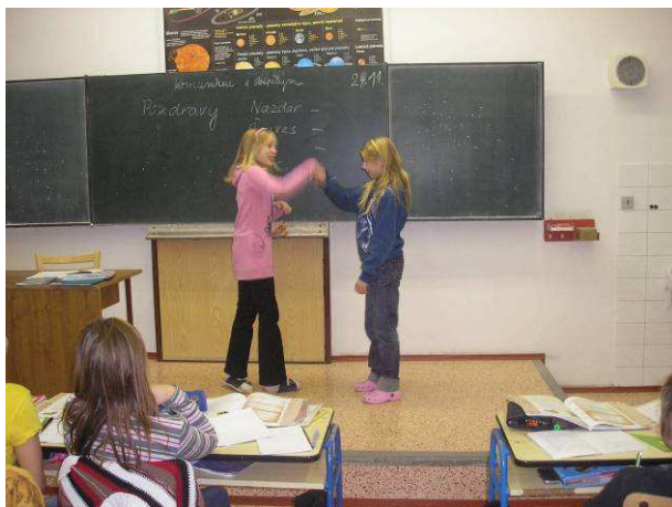
poprvé je to těžké

Úkolem třetí části – Komunikace s dospělým bylo seznámit žáky s pravidly chování k dospělým (k učitelům, cizím lidem, rodičům apod). Žáci samostatně vymýšleli různá pravidla chování a následně po společném shrnutí je sepsali. Ve druhé polovině této části jsme se věnovali pozdravům slovním, ale také praktickým. Žáci si vyzkoušeli správně pozdravit podáním ruky a v úplném závěru jsme se věnovali také pozdravům, které se používaly v dřívějších dobách.